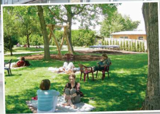
In der Natur und dennoch nahe einer Großstadt: die Tagungsstätte Thomashof in Karlsruhe-Durlach.

Probewochenenden sind ein bewährtes Mittel, um einen Chor auf einen Auftritt vorzubereiten und gleichzeitig die Chorgemeinschaft zu stärken. In dieser Serie stellen wir Lokaltäten vor, die von Chören unseres Verbands genutzt und für geeignet befunden wurden. Sie finden die Serie immer in der Mitte des Hefts, so dass Sie die Seiten problemlos heraustrennen und sammeln können.