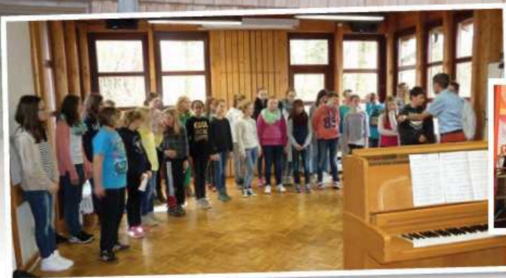
Das Jugendchorprojekt des Chorverbands Mosbach aus dem Jahr 2014 in der Jugendbildungsstätte Neckarzimmern.

Sie können ebenfalls einen geeigneten Ort für ein Probewochenende empfehlen? Dann melden Sie sich bei der Redaktion von Baden vokal unter martin.bernhard@bcvonline.de oder 06281 564338.