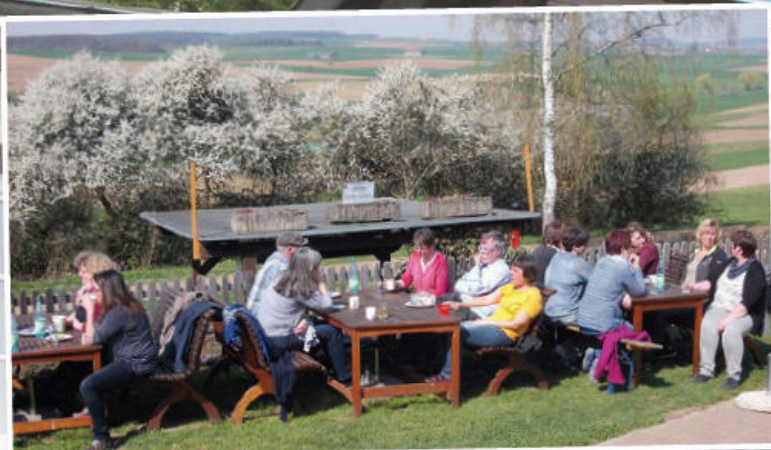
Geselliges Beisammensein auf der Terrasse.

Probewochenenden sind ein bewährtes Mittel, um einen Chor auf einen Auftritt vorzubereiten und gleichzeitig die Chorgemeinschaft zu stärken. In dieser Serie stellen wir Lokalitäten vor, die von Chören unseres Verbands genutzt und für geeignet befunden wurden. Sie finden die Serie immer in der Mitte des Hefts, so dass Sie die Seiten problemlos heraustrennen und sammeln können.