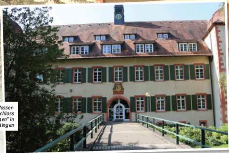
Das Wasserschloss "Schloss Flehingen" in Oberderdingen

Sie können ebenfalls einen geeigneten Ort für ein Probewochenende empfehlen? Dann melden Sie sich bei der Redaktion von Baden vokal unter martin.bernhard@bcvonline.de oder 06281 564388