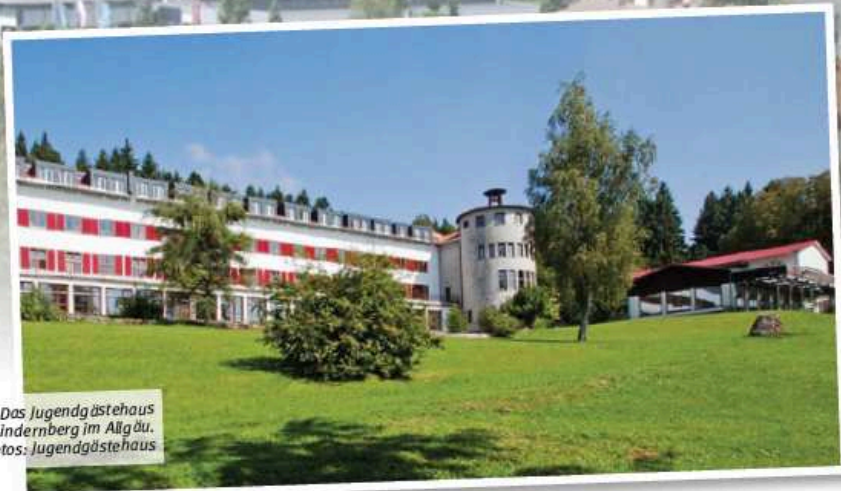
Das Jugendgästehaus Lindenberg im Allgäu.

Probewochenenden sind ein bewährtes Mittel, um einen Chor auf einen Auftritt vorzubereiten und gleichzeitig die Chorgemeinschaft zu stärken. In dieser Serie stellen wir Lokallitäten vor, die von Chören unseres Verbands genutzt und für geeignet befunden wurden. Sie finden die Serie immer in der Mitte des Hefts, so dass Sie die Seiten problemlos herausrennen und sammeln können. Sie können ebenfalls einen geeigneter Ort für ein Probewochenende empfehlen? Dann melden Sie sich bei der Redaktion von Baden vokal unter martin.bemhard@bcvonline.de oder 06281 564338.