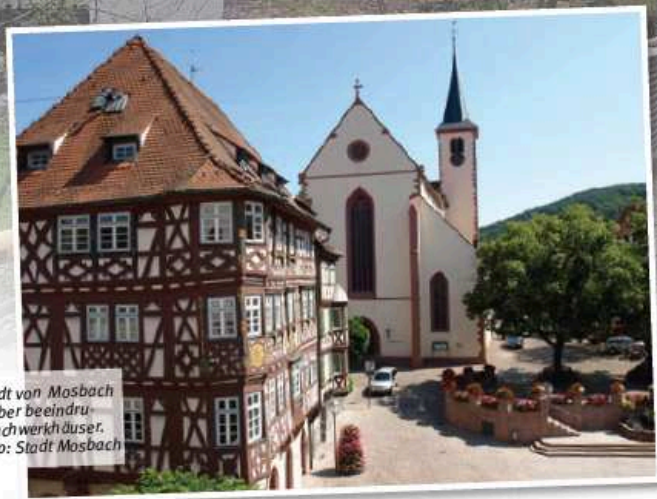
Die Altstadt von Mosbach verfügt über beeindruckende Fachwerkhäuser.

Probewochenenden sind ein bewährtes Mittel, um einen Chor auf einen Auftritt vorzu bereiten und gleichzeitig die Chorgemeinschaft zu stärken. In dieser Serie stellen wir Lokalitäten vor, die von Chören unseres Verbands genutzt und für geeignet befunden wurden. Sie finden die Serie immer in der Mitte des Hefts, so dass Sie die Seiten problemlos heraustrennen und sammeln können. Sie können ebenfalls einen geeigneten Ort für ein Probewochenende empfehlen? Dann melden Sie sich bei der Redaktion von Baden vokal unter martin.bernhard@bcvonline.de oder 06281 564 118.