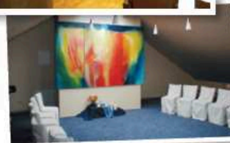
Modern eingerichtet mit unterschiedlichen Räumlichkeiten bietet der Thomashof gute Voraussetzungen für ein Probewochenende.