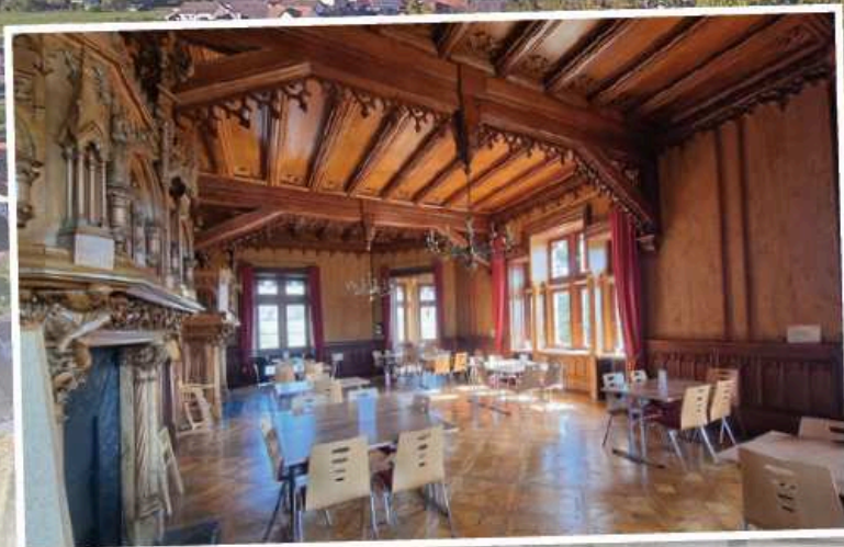
Der Rittersaal im Schloss dient als Speisesaal