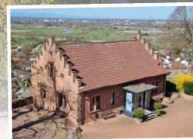
Märchenhaft gelegen auf der Kuppe eines Hügels ist Schloss Ortenberg. Man übernachtet hier in historischen Gemäuern.