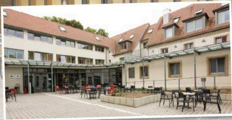
Die Jugendherberge Mannheim International bietet Platz für große Gruppen drinnen und im Freien.

Sie können ebenfalls einen geeigneten Ort für ein Probewochenende empfehlen? Dann melden Sie sich bei der Redaktion von Baden vokal unter martin.bernhard@bcvonline.de oder 06281 564338.