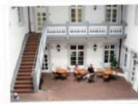
Blick ins Wasserschloss: schöne Räume und eine angenehme Atmosphäre zeichnen das denkmalgeschützte Gebäude aus.