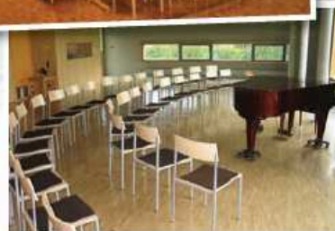
Die Heimvolkshochschule verfügt über modern ausgestattete Räume, die sich gut zum Singen eignen.