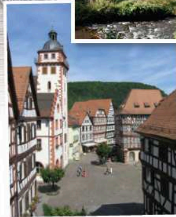
Mutschlers Mühle (oben) ist idyllisch gelegen. Ein Abstecher in die Mosbacher Altstadt lohnt sich (unten).

aus dem Fenster – die Uferlandschaft der Elz liegt direkt vor der Tür. Fünf verschiedene Gebäudetrakte sind teilweise in die Bausubstanz einer historischen Mühle integriert. Die Jugendherberge verfügt über einen großen Proberaum sowie über ein Klavier und ein Keyboard.