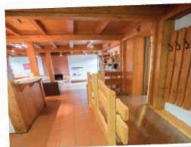
Idyllisch gelegen und modern eingerichtet ist die Jugendbildungsstätte Neckarzimmern.