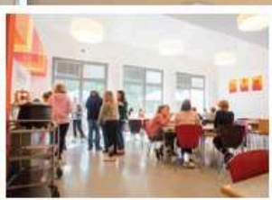
Die Kantine in der Jugendbildungsstätte.