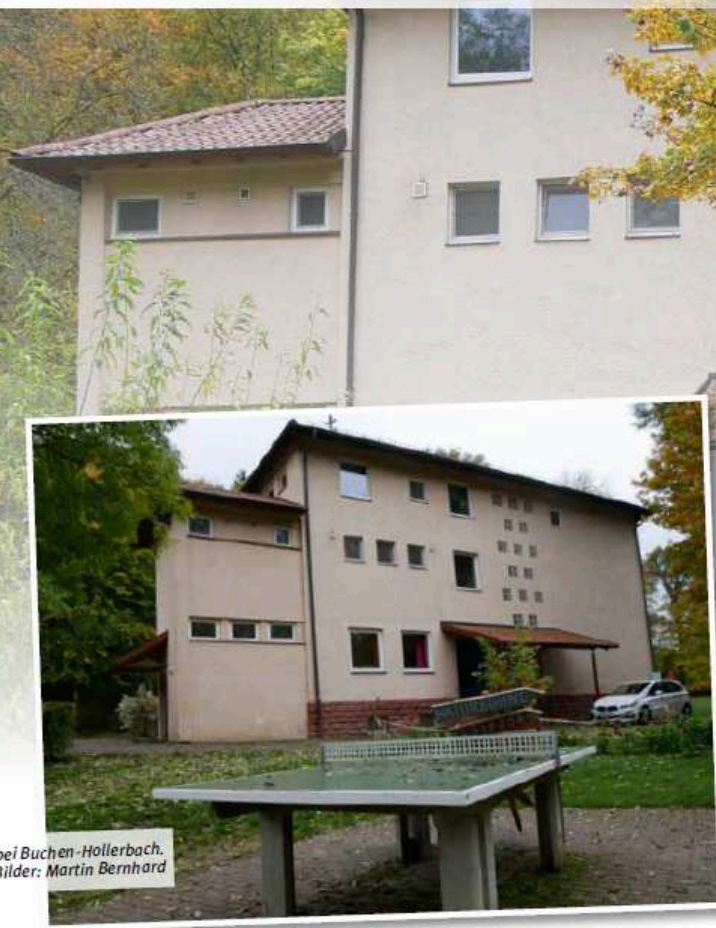
Das Hollerhaus bei Buchen-Hollerbach.

Probewochenenden sind ein bewährtes Mittel, um einen Chor auf einen Auftritt vorzubereiten und gleichzeitig die Chorgemeinschaft zu stärken. In dieser Serie stellen wir Lokalitäten vor, die von Chören unseres Verbands genutzt und für geeignet befunden wurden. Sie finden die Serie immer in der Mitte des Hefts, so dass Sie die Seiten problemlos heraustrennen und sammeln können. Sie können ebenfalls einen geeigneten Ort für ein Probewochenende empfehlen? Dann melden Sie sich bei der Redaktion von Baden vokal unter martin.bernhard@bcvonline.de oder 06281 564338. Die Artikel über alle vorgestellten Probe-Lokalitäten finden Sie unter https://www.bcvonline.de/Vereine/Probewochenenden/