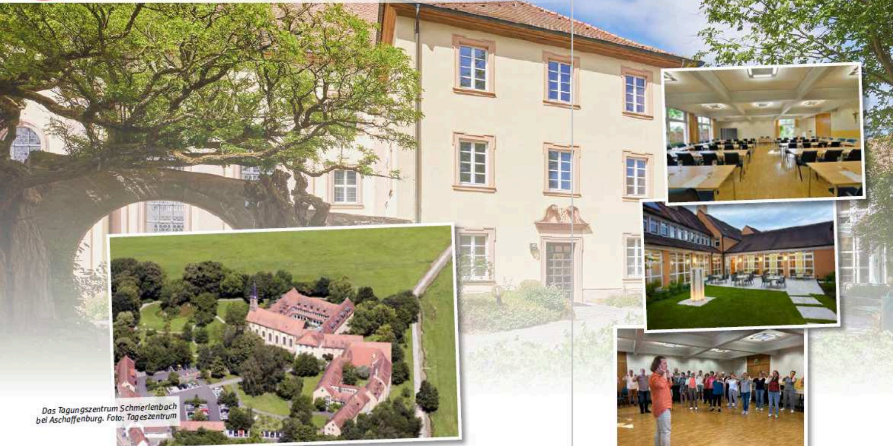
Das Tagungszentrum Schmerlenbach bei Aschaffenburg.

Probewochenenden sind ein bewährtes Mittel, um einen Chor auf einen Auftritt vorzubereiten und gleichzeitig die Chorgemeinschaft zu stärken. In dieser Serie stellen wir Lokaltäten vor, die von Chören unseres Verbands genutzt und für geeignet befunden wurden. Sie finden die Serie immer in der Mitte des Hefts, so dass Sie die Seiten problemlos heraustrennen und sammeln können. Sie können ebenfalls einen geeigneten Ort für ein Probewochenende empfehlen? Dann melden Sie sich bei der Redaktion von Baden vokal unter martin.bernhard@bcvonline.de oder 06281 564338. Die Artikel über alle vorgestellten Probe-Lokaltäten finden Sie unter https://www.bcvonline.de/Verelne/Probewochenenden/