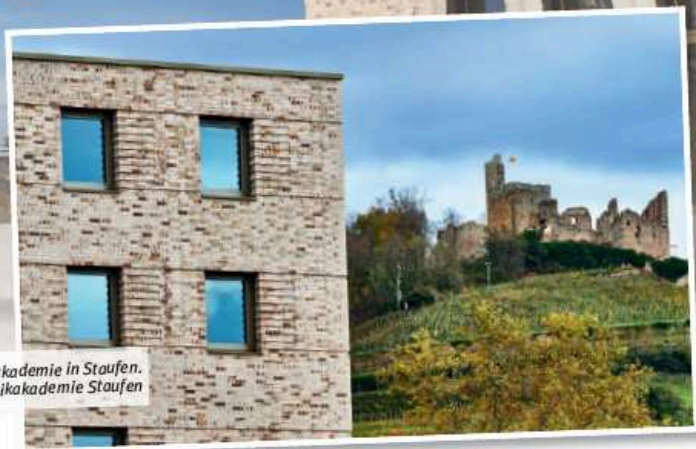
Die Musikakademie in Staufen.

Probewochenenden sind ein bewährtes Mittel, um einen Chor auf einen Auftritt vorzubereiten und gleichzeitig die Chorgemeinschaft zu stärken. In dieser Serie stellen wir Lokalitäten vor, die von Chören unseres Verbands genutzt und für geeignet befunden wurden. Sie finden die Serie immer in der Mitte des Hefts, so dass Sie die Seiten problemlos heraustrennen und sammeln können. Sie können ebenfalls einen geeigneten Ort für ein Probewochenende empfehlen? Dann melden Sie sich bei der Redaktion von Baden vokal unter martin.bemhard@bcvonline.de oder 06281 564338. Die Artikel über alle vorgestellten Probe-Lokalitäten finden Sie unter https://www.bcvonline.de/Vereine/Probewochenenden/