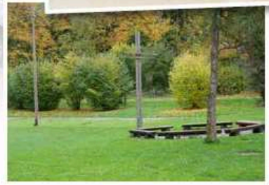
Das Haus bietet mehrere Räume zum Proben und für geselliges Beisammensein, sowie eine großen Außenanlage.