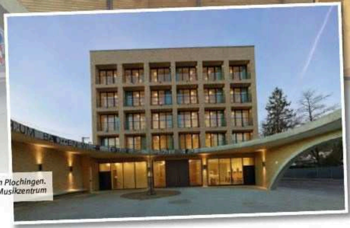
Das Musikzentrum Plochingen.