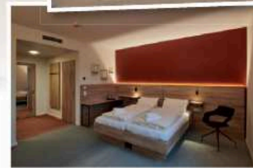
Modern, zweckmäßig, ansprechend: die Räume der Musikakademie in Staufen.