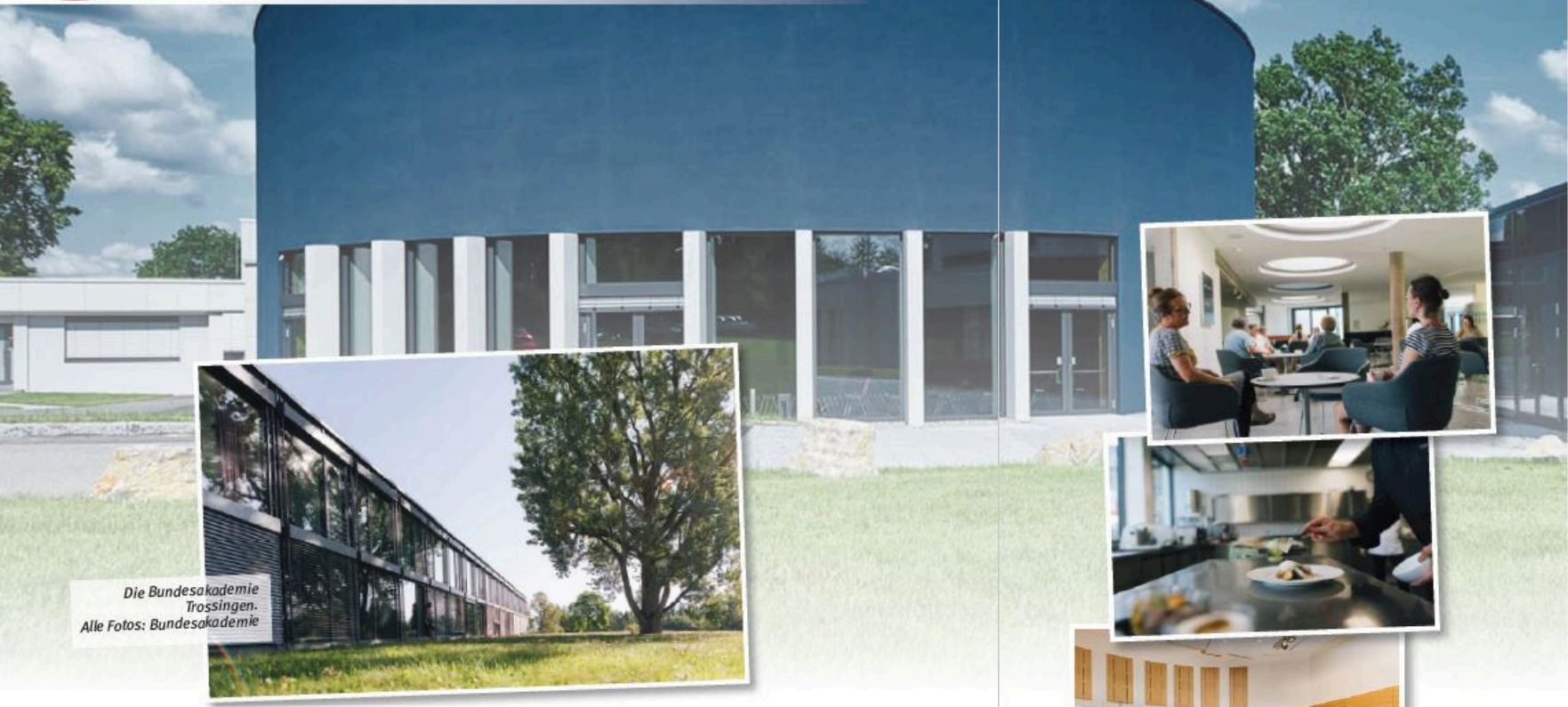
Die Bundesakademie Trossingen.

Probewochenenden sind ein bewährtes Mittel, um einen Chor auf einen Auftritt vorzubereiten und gleichzeitig die Chorgemeinschaft zu stärken. In dieser Serie stellen wir Lokalitäten vor, die von Chören unseres Verbands genutzt und für geeignet befunden wurden. Sie finden die Serie immer in der Mitte des Hefts, so dass Sie die Seiten problemlos heraustrennen und sammeln können. Sie können ebenfalls einen geeigneten Ort für ein Probewochenende empfehlen? Dann melden Sie sich bei der Redaktion von Baden vokal unter martin.bemhard@bcvonline.de oder 06281 564338. Die Artikel über alle vorgestellten Probe-Lokalitäten finden Sie unter https://www.bcvonline.de/Vereine/Probewochenenden/