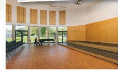
Geeignete Räume laden zum Verweilen und Musizieren ein.