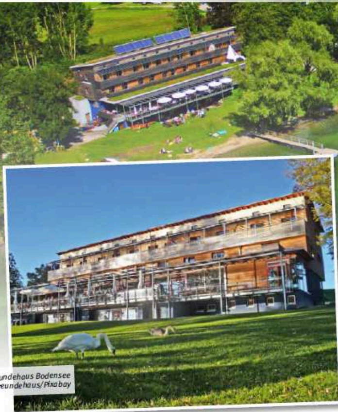
Naturfreundehaus Bodensee

Probewochenenden sind ein bewährtes Mittel, um einen Chor auf einen Auftritt vorzubereiten und gleichzeitig die Chorgemeinschaft zu stärken. In dieser Serie stellen wir Lokalitäten vor, die von Chören unseres Verbands genutzt und für geeignet befunden wurden. Sie finden die Serie immer in der Mitte des Hefts, so dass Sie die Seiten problemlos heraustrennen und sammeln können. Sie können ebenfalls einen geeigneten Ort für ein Probewochenende empfehlen? Dann melden Sie sich bei der Redaktion von Baden vokal unter martin.bernhard@bcvonline.de oder 06281 564338. Die Artikel über alle vorgestellten Probe-Lokalitäten finden Sie unter https://www.bcvonline.de/Vereine/Probewochenenden/